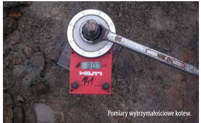
Pomiary wytrzymałościowe kotew.