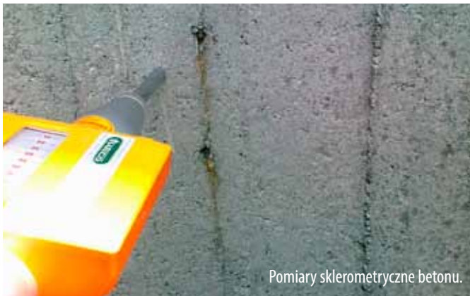
Pomiary sklerometryczne betonu.