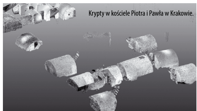
Krypty w kościele Piotra i Pawła w Krakowie.