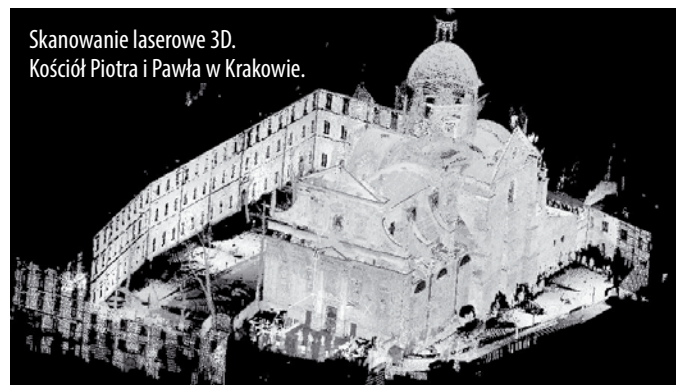
Skanowanie laserowe 3D. Kościół Piotra i Pawła w Krakowie.