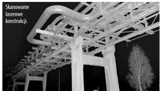
Skanowanie laserowe konstrukcji.