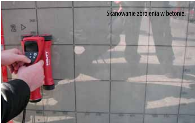
Skanowanie zbrojenia w betonie.