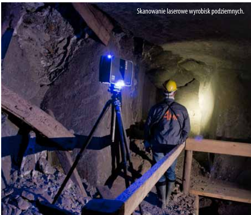
Skanowanie laserowe wyrobisk podziemnych.