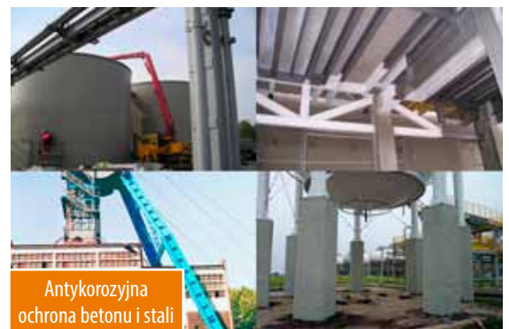
Antykorozyjna ochrona betonu i stali