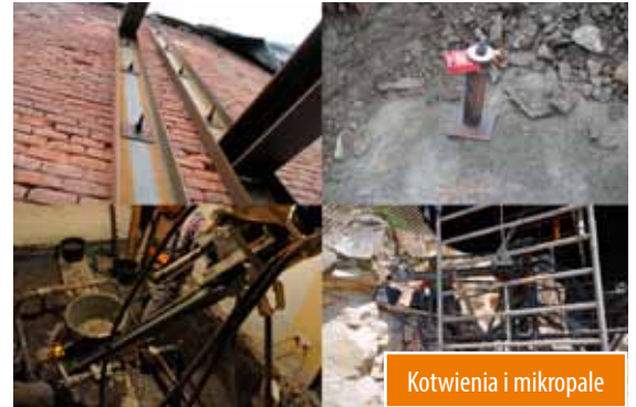
Kotwienia i mikropale