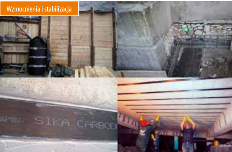
Wzmocnienia i stabilizacja