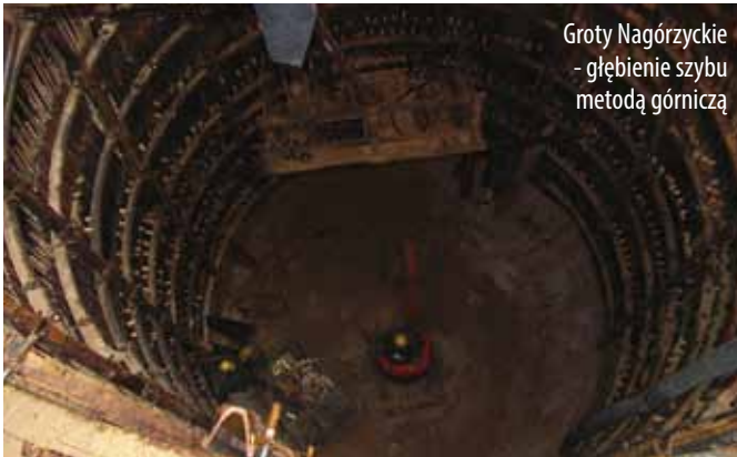
Groty Nagórzyckie - głębienie szybu metodą górniczą