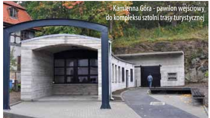
Kamienna Góra - pawilon wejściowy do kompleksu sztolni trasy turystycznej