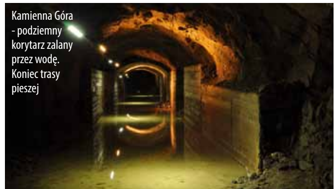
Kamienna Góra - podziemny korytarz zalany przez wodę. Koniec trasy pieszej