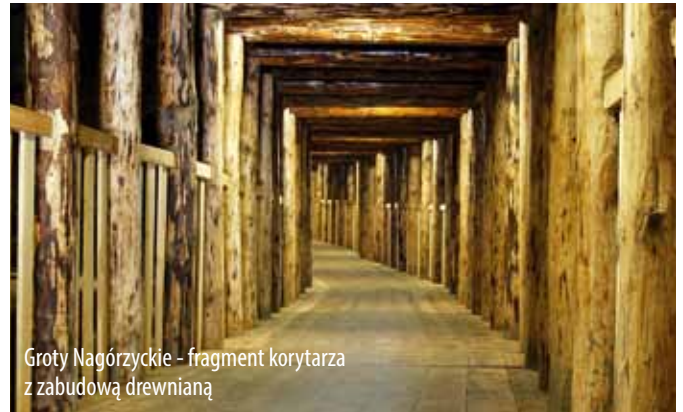
Groty Nagórzyckie - fragment korytarza z zabudową drewnianą