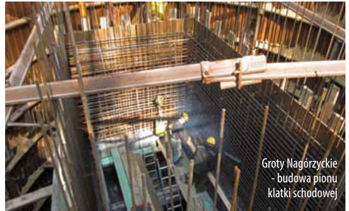
Groty Nagórzyckie - budowa pionu klatki schodowej