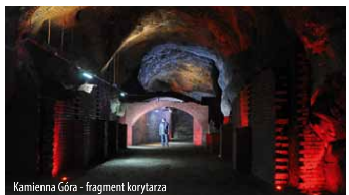
Kamienna Góra - fragment korytarza