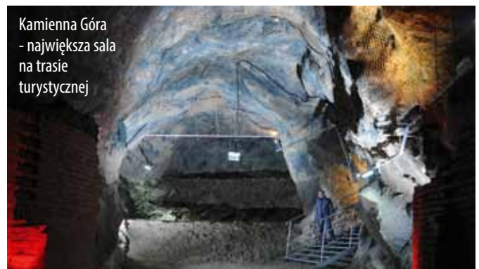
Kamienna Góra - największa sala na trasie turystycznej