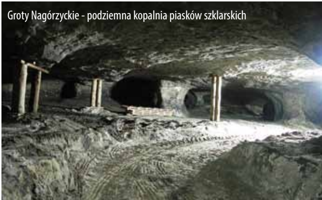
Groty Nagórzyckie - podziemna kopalnia piasków szklarskich